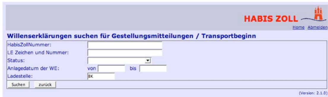
Abbildung 10: Willenserklärungen suchen für Gestellungsmittelungen

Nach Absenden des Suchformulars erscheint das Suchergebnis. Durch Markieren der entsprechenden Ladeeinheit(en) und Betätigen der Funktion „Gestellungsmittelung senden“ wird für die ausgewählten Ladeeinheiten jeweils eine Gestellungsmittelung an den Zoll übermittelt.