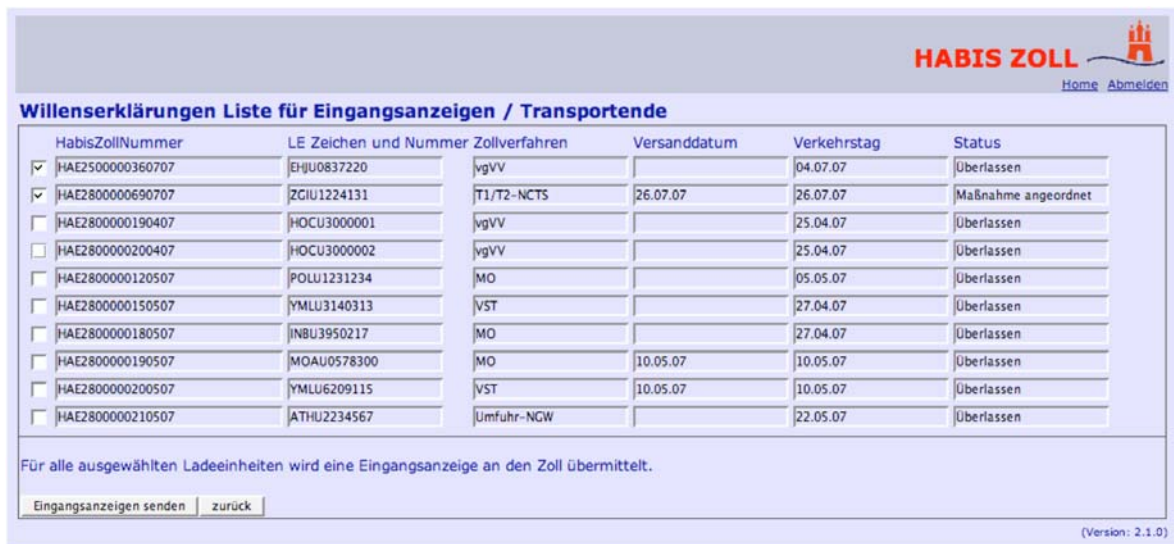
Abbildung 14: Willenserklärungen Liste für Eingangsanzeigen

Nach Absenden des Suchformulars erscheint das Suchergebnis. Durch Markieren der entsprechenden Ladeeinheit(en) und Betätigen der Funktion „Eingangsanzeige senden“ wird für die ausgewählten Ladeeinheiten jeweils eine Eingangsanzeige an den Zoll übermittelt.