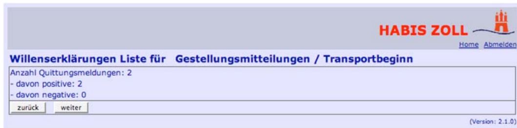
Abbildung 12: Quittungsmeldung für Gestellungsmitteilungen