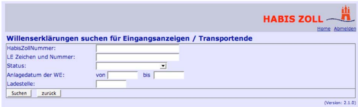
Abbildung 13: Willenserklärungen suchen für Eingangsanzeige

Nach Absenden des Suchformulars erscheint das Suchergebnis. Durch Markieren der entsprechenden Ladeeinheit(en) und Betätigen der Funktion „Eingangsanzeige senden“ wird für die ausgewählten Ladeeinheiten jeweils eine Eingangsanzeige an den Zoll übermittelt.