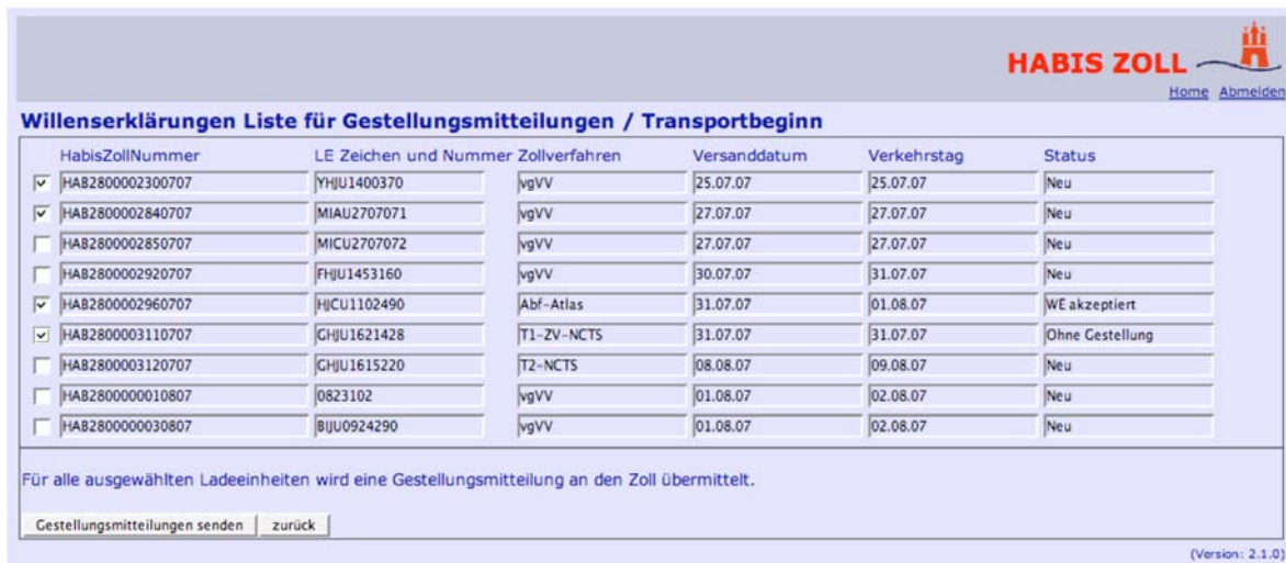
Abbildung 11: Willenserklärungen Liste für Gestellungsmittelungen

Im Anschluss daran erscheint eine Quittungsansicht, die die Anzahl der positiven bzw. negativen Quittungsmeldungen für die Gestellungsmittelungen anzeigt.