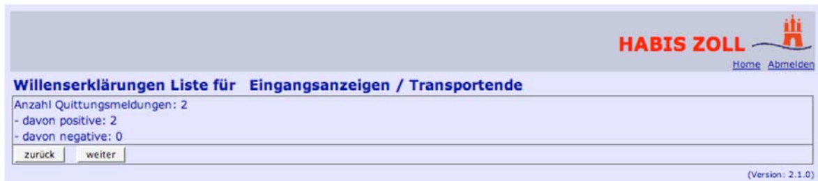
Abbildung 15: Quittungsmeldungen für Eingangsanzeigen